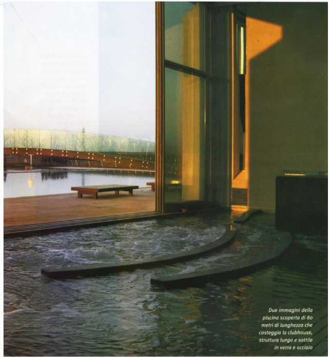
Due immagini della piscina scoperta di 80 metri di lunghezza che costeggia la clubhouse, struttura lunga e sottile in vetro e acciaio